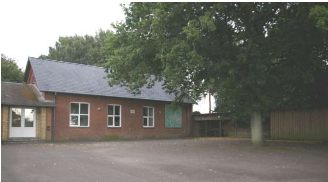
Foto – 2011 – af Vrigstedhus – Vrigsteds nye forsamlingshus og gamle skole.

1989- : Foreningen Vrigsted Forsamlingshus oprettedes og købte bygningen af Juelsminde Kommune for 5 kr. I starten af Vrigstedhus’ s historie var den centrum for en mængde af aktiviteter, idet der, udover forsamlingshusudvalget der forestod bygningens udlejning og vedligeholdelse, blev oprettet et kulturudvalg og senere – 1992 et bylaug, der alle brugte og arrangerede aktiviteter i og omkring forsamlingshuset.